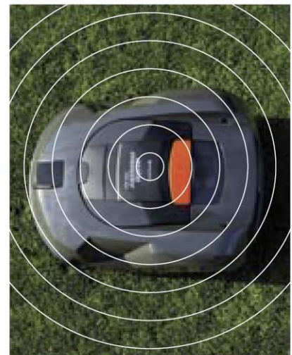
Diebstahlsicherung mit Alarm. Der Automower hat eine Diebstahlsicherung mit Alarm und PIN-Code für maximale Sicherheit