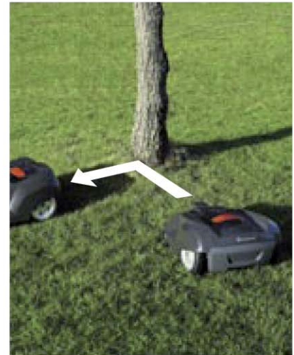
Eine Begrenzungsschleife sorgt dafür, dass Gegenstände umfahren werden. geschickt