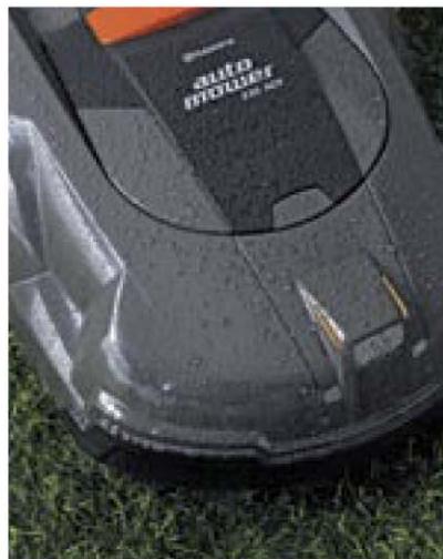
Tag oder Nacht, Regen oder Sonnenschein. den Automower stört es nicht, wenn es regnet. Er mäht Ihren Rasen zuverlässig bei jedem Wetter.