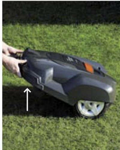
Automatische Abschaltung. Wird der Automower angehoben, stoppen automatisch die Schneidmesser,