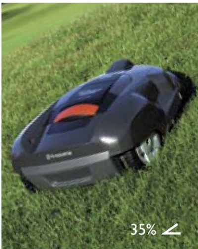
Neigungen sind kein Problem. Rasenflächen mit bis zu 35 % können problemlos überwunden werden.